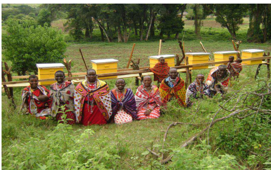
Narotia vrouwen bij de bijenkorven

De bijenhouderij van Entashata, en die van Narotia hebben de eerste honing oogst achter de rug. Een oogst van ca. 30 kg honing. Voorlopig wordt dit aan Maasai verkocht, onder andere voor het maken van Maasai bier. Om de honing ook in Narok en Nairobi te kunnen verkopen, moet de honing bewerkt worden. De daarvoor benodigde apparatuur is al wel onderwerp van gesprek geweest, maar er is nog geen verzoek met plan en kosten gedaan. Nog niet alle bijenkasten waren bezet door een bijenvolk. Er is dus nog sprake van uitbreiding zonder extra investeringen. We blijven vanzelfsprekend de ontwikkelingen volgen.