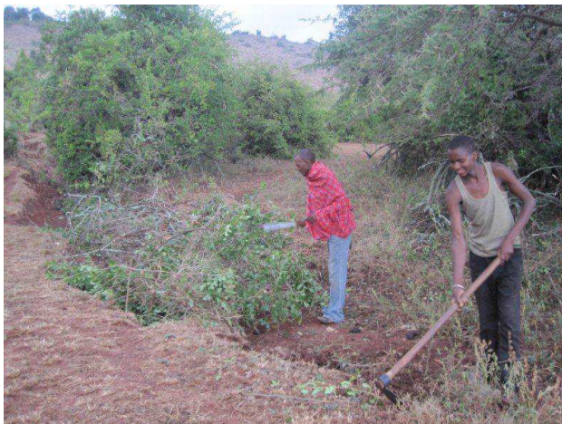
Aanleg van de 'weg' naar de waterbron

Er is een doorgang en een 'weg' gemaakt naar de waterbron. De bereikbaarheid van de bron was een eerste vereiste. De benodigde materialen kunnen nu met de Landrover tot aan de bron gebracht worden.