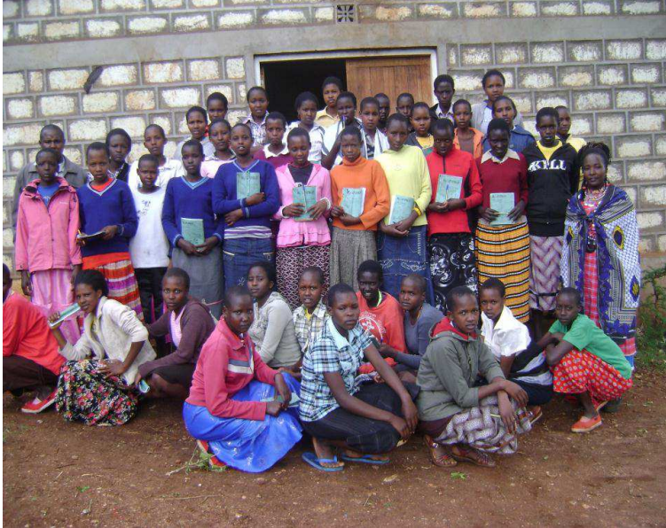
Deelnemers aan TEMA Workshop

De activiteiten van TEMA worden ook in 2013 gesteund door Maji. De bijeenkomsten met de vrouwengroepen en de voorlichtingsbijeenkomsten op