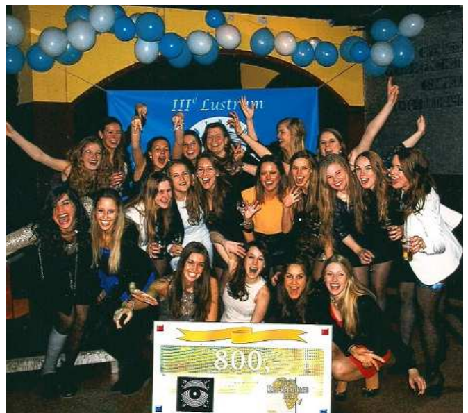
Tilburgs damesdispuut Amendus Amandus (AA)

In 2012 heeft Maji het voor 15 meisjes mogelijk gemaakt onderwijs te volgen in het Secondary (Middelbaar) onderwijs. Voor 2013 is door Maji budget beschikbaar gesteld voor het betalen van het schoolgeld voor 23 meisjes. In 2009 is Maji deze steun gestart voor 3 meisjes. In 2010 ging het om 5 en in 2011 om 7 meisjes. Dit laat zien dat er ontwikkeling is. Langzaam, maar zeker. Maji is trots op het kunnen leveren van een bijdrage aan deze ontwikkeling. Grote en kleine donaties maken dit werk mogelijk. Zo heeft Maji in dit voorjaar een donatie van € 810,00 ontvangen van het damesdispuut Amendus Amandus (AA) , een dispuut van de Studentenvereniging Plato in Tilburg. Hiervoor heeft het dispuut een inzameling gehouden bij de ouders en bekenden van de studenten. Een fantastische gift! Mede namens de meisjes in Loita gaat onze hartelijk dank nogmaals uit naar het dispuut Amendus Amandus. Hartstikke bedankt!!